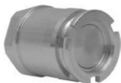
Адаптер быстроразъёмного соединения «сухого разъёма» x внутренняя резьба NPT с уплотнением витон (VITON)