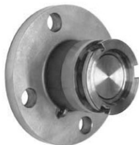
Адаптер быстроразъёмного соединения «сухого разъёма» x фланец 150# ASA с уплотнением витон (VITON)