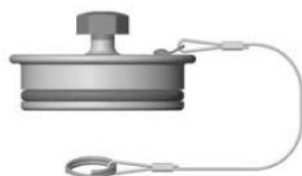
Заглушка для соединений из композитных материалов