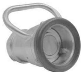
Быстроразъёмные соединения «сухого разъёма» x розетка NPT с уплотнением витон (VITON)