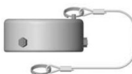
Заглушка адаптера быстроразъёмного соединения «сухого разъёма»